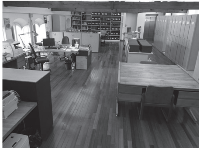
Sala Treball i consulta de l'Arxiu del Monestir de Bellpuig de les Avellanès

tral, el tractament documental de la documentació històrica, la gestió de les consultes, la gestió de la biblioteca, la coordinació de projectes d'arxiu amb la Montse, etc. Progressivament també ha anat col·laborant en l'organització d'activitats culturals i en el disseny i la gestió del Portal Web del Monestir, que inclou el web de l'Arxiu del Monestir i de l'Arxiu Gavín. Un dels reptes inicials amb què es va trobar va ser el d'organitzar el fons de la Vicepostuladora Marista, procedent de l'Arxiu General de Roma i que ara forma part de l'Arxiu del Monestir de Bellpuig de les Avellanès.